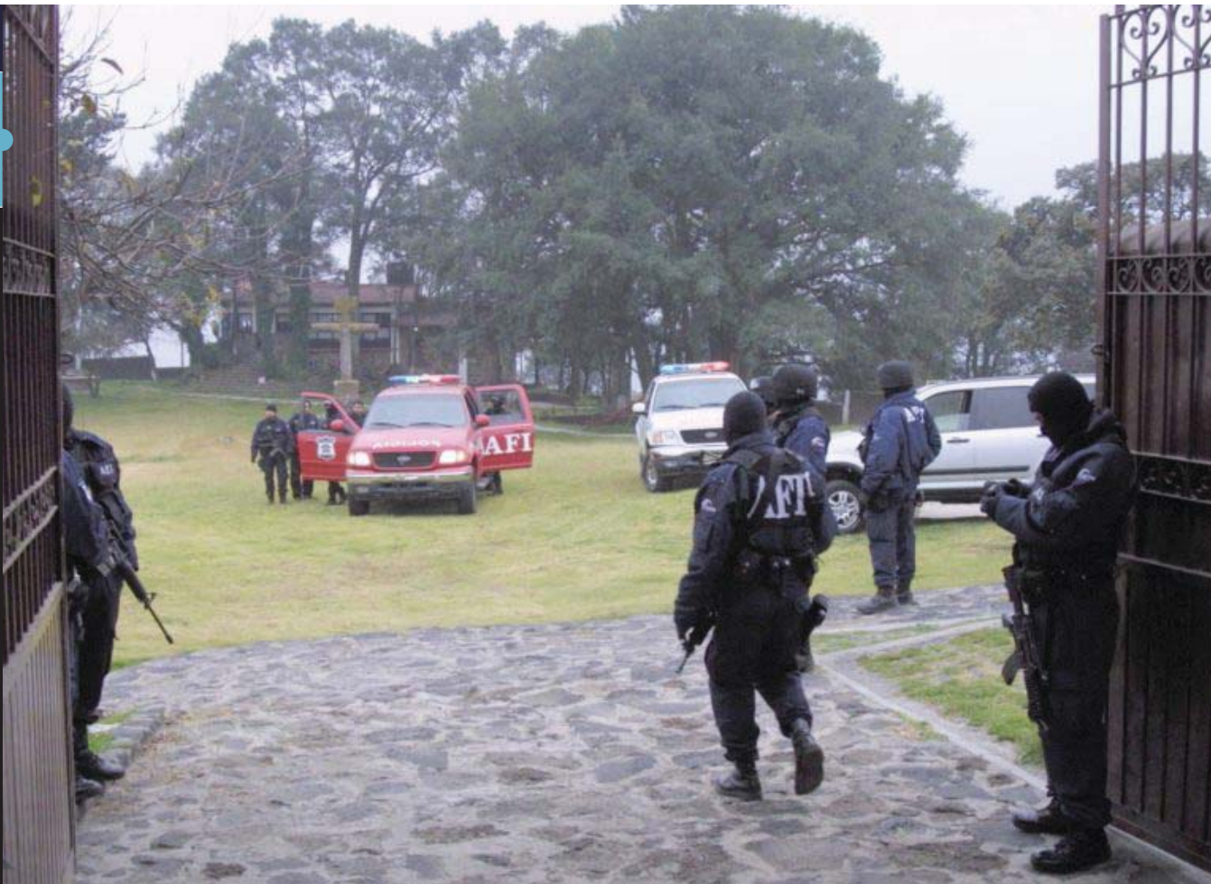
Fotografía del rancho donde, según la SSP, fueron rescatadas las víctimas.